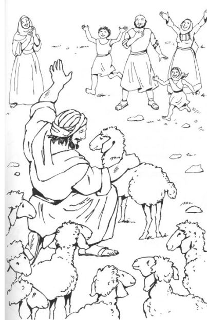
Jesus redete in Gleichnisse. So haben die Menschen seine Botschaft vom Reich Gottes verstehen können. - Verlorenes Schaf -