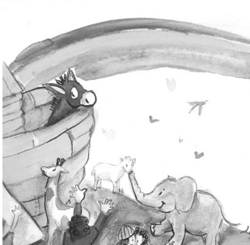
Noah und Bund Gottes mit den Menschen