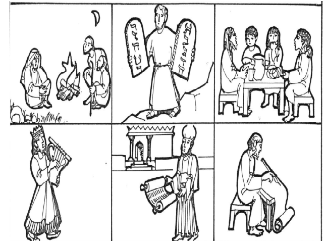
Der Weg des Gottesvolk Israel