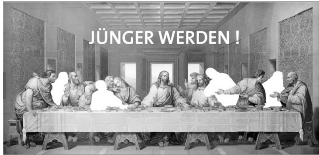
Das letzte Abendmahl – Male deine Freunde und Dich in die Runde.